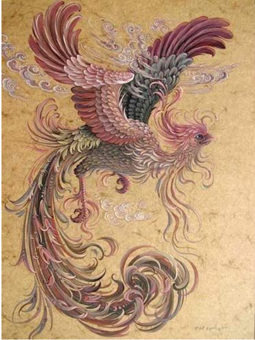
O mítico Simurg iraniano

Concerto 3. Domingo 28 Marzo ás 19:00 horas