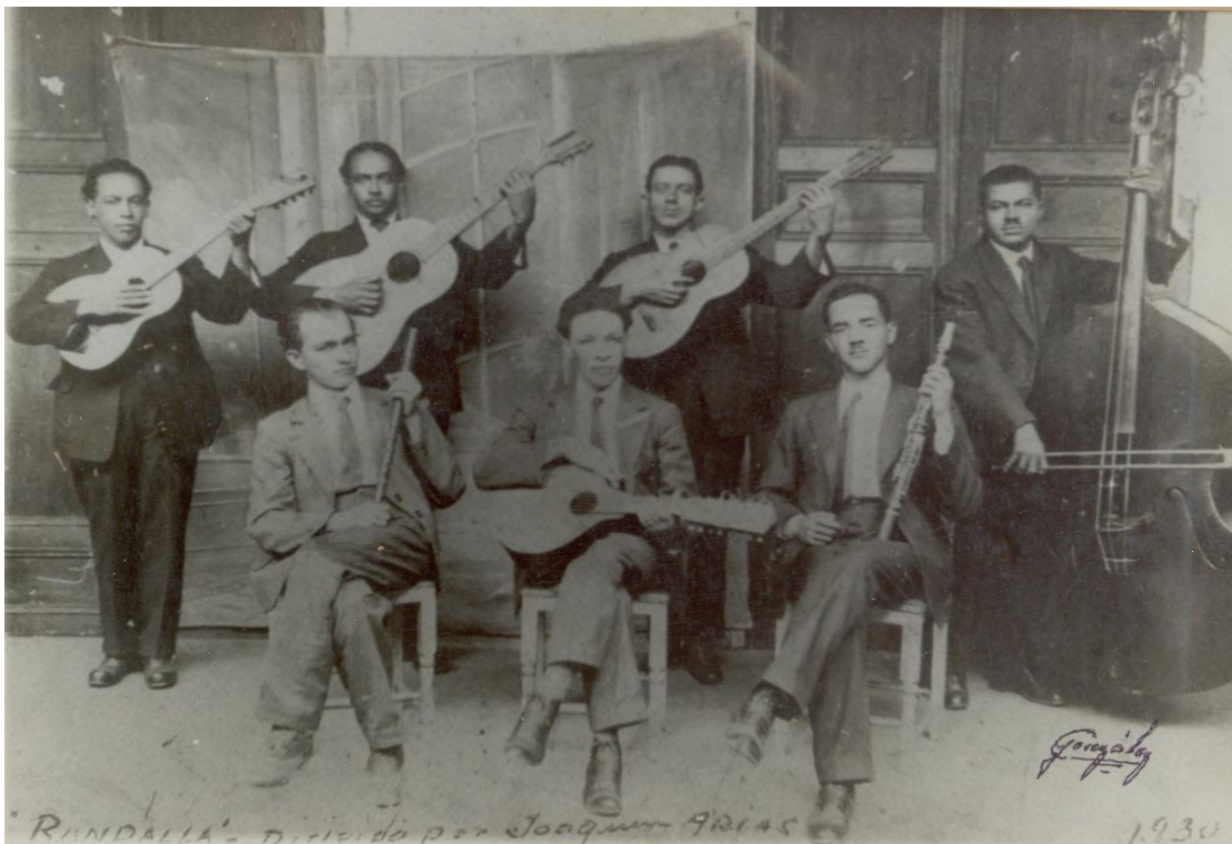
Músicos colombianos do Val do Cauca

Concerto 2. Domingo 21 de marzo ás 19:00 horas