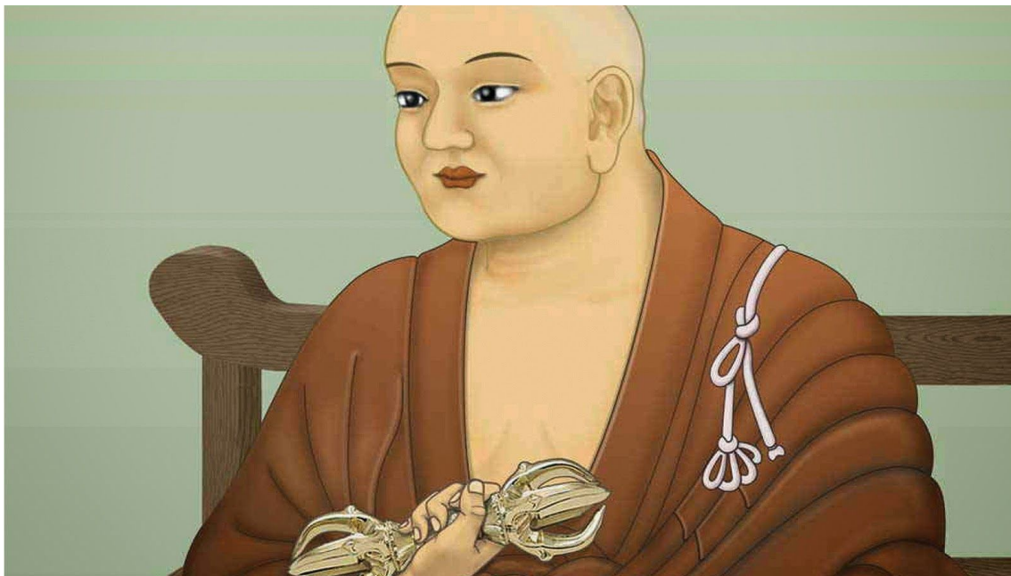
Kūkai, 空海, (774–835)

Concerto 1. Domingo 28 Febreiro ás 19:00 horas 9bWfi Wj`UXU para dous pianos